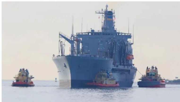
Buques militares de EUA cerca de Ensenada, Baja California a inicio de año